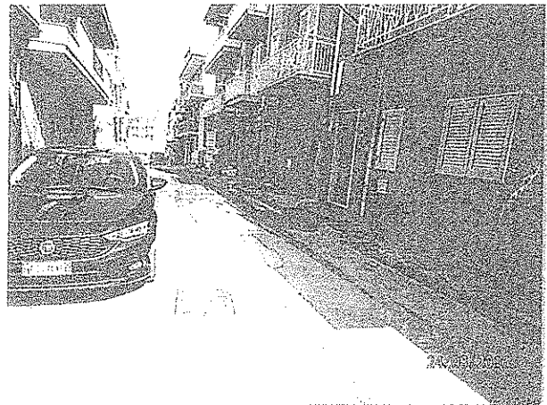
Via Civiletti n°33 ripristino con cls.