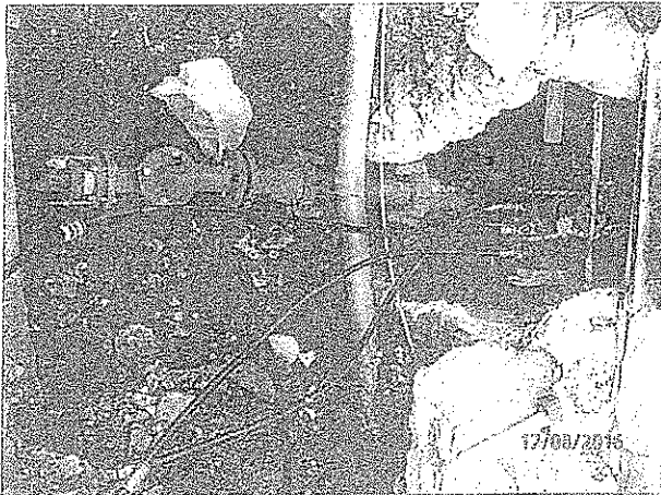
Via Roma n° 142 Particolare attacco centro gallo.