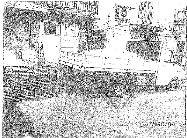
via Roma n° 142 detrito per riempimento