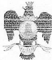
CITTA' DI LICATA