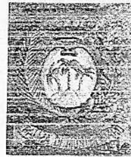
COMUNE DI PALMA DI MONTECHIARO

OGGETTO : SCHEMA DI " PROGETTO MIGLIORATIVO" per l'iscrizione all'Albo Distrettuale provvisorio degli Enti accreditati per l'affidamento del servizio Assistenza domiciliare per la realizzazione di progetti assistenziali rivolti a persone in condizione di disabilità gravissima.